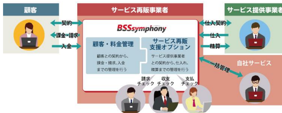
図1 「BSSsymphony サービス再販支援オプション」の概要図

*1: 月額基本料金や従量課金、日割計算、各種割引、年縛り契約などの料金プランや割引