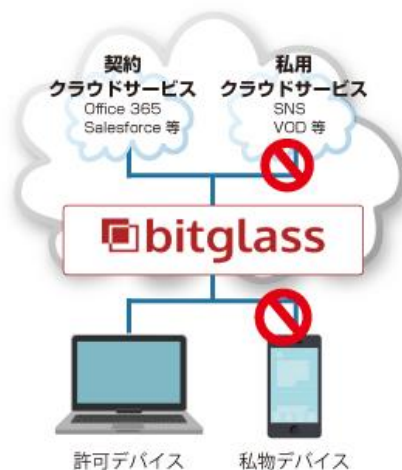
図 CASBサービス「Bitglass」の概要

今回、日立ソリューションズは、海外で 350 社 100 万ユーザの導入実績がある「Bitglass」をクラウドセキュリティ強化ソリューションのラインナップに追加し、企業の業態や課題に応じ、機密性の高い情報も安心して活用できるクラウドソリューションをトータルに提供していきます。