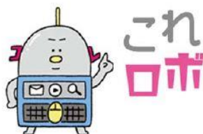
活動推進キャラクターのこれロボくん

今後も、AI を活用しての問い合わせ業務のチャットボット化や事例といった最新情報の提供など、日立ソリューションズにはさらなるサポートを期待しています。」