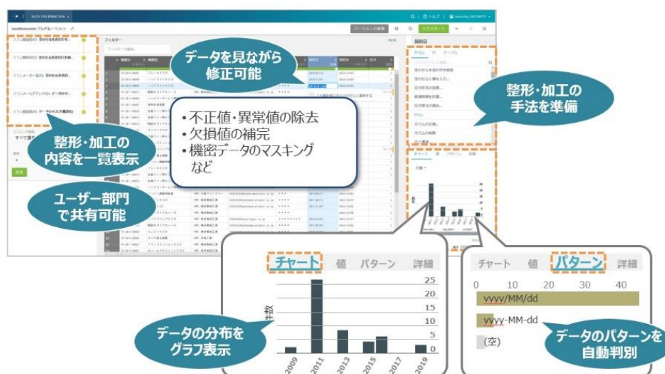
図 1 視覚的にデータの整形や加工を行えるツールを利用した画面

*3:データプレパレーションとは、分析に必要なさまざまなデータを整形・加工し、分析するための前処理を行うこと