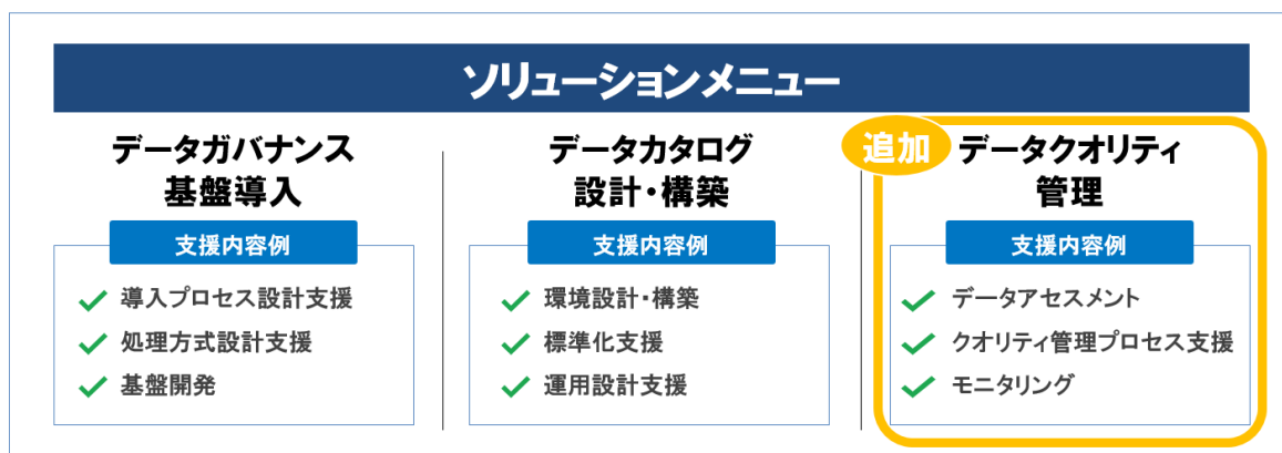
図2 データガバナンスソリューション ソリューションメニュー