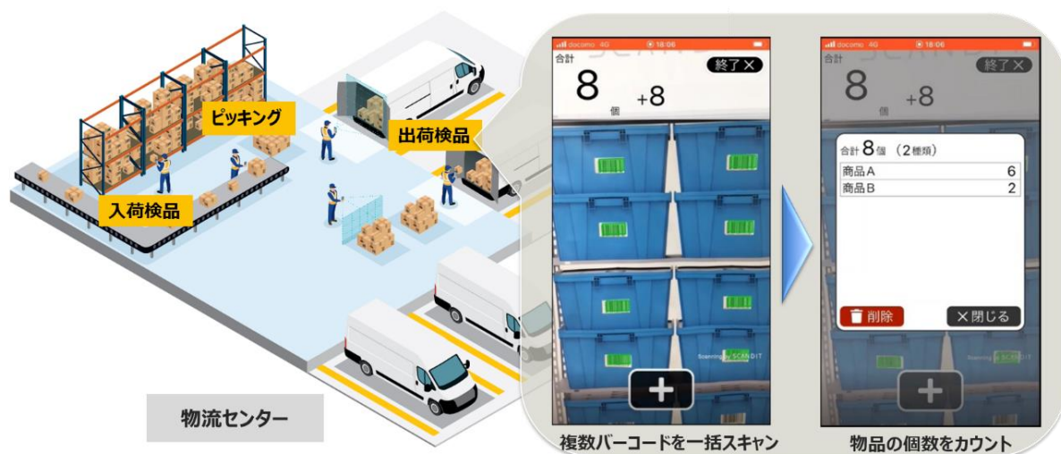
図: 入出荷検品を活用した例

*2: 物流業務の効率化の実現イメージは、こちらの動画( https://youtu.be/Jw5sfJewW-0 )をご覧ください。