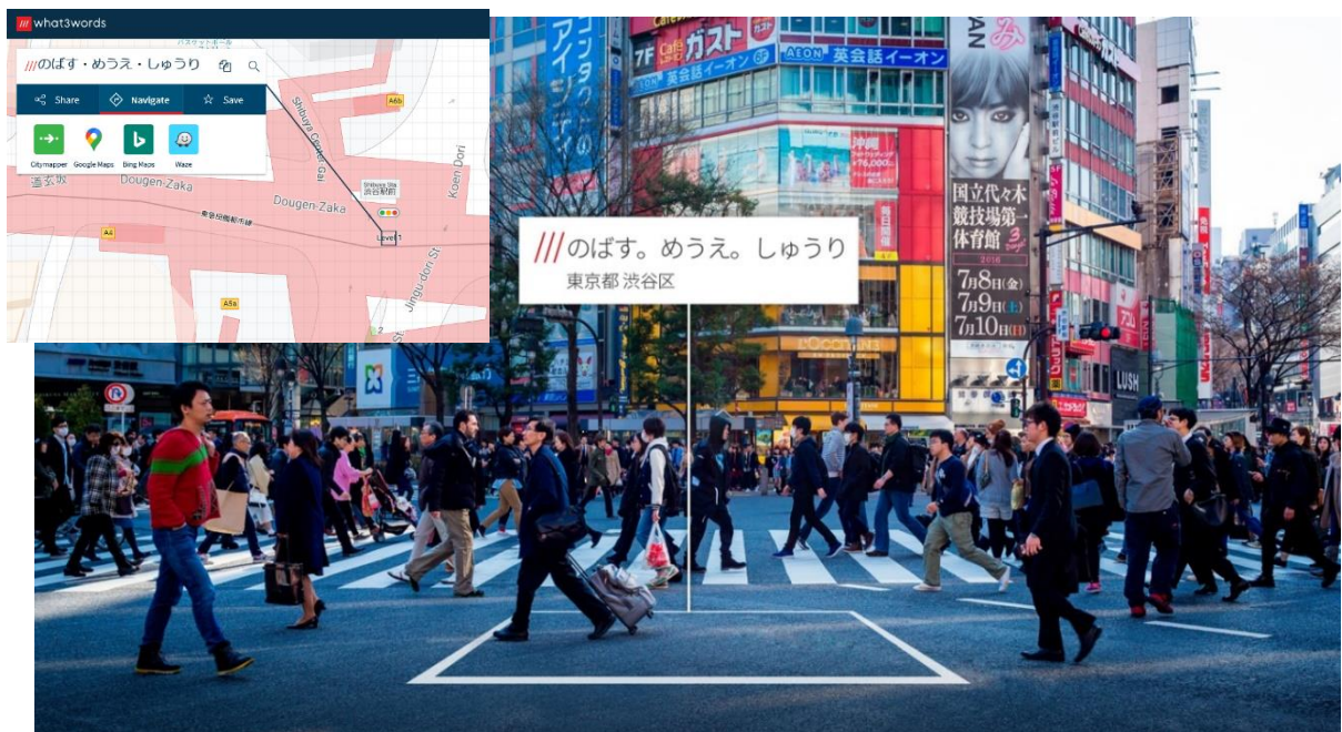
図 住所で特定できない場所を示すイメージ

日立ソリューションズは、今後も、場所に関わるサービスを提供している企業に向けて本サービスを販売することで、デジタルトランスフォーメーション(DX)を支援していきます。