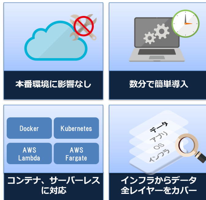
図 2: 「クラウドセキュリティ態勢管理サービス」の特長