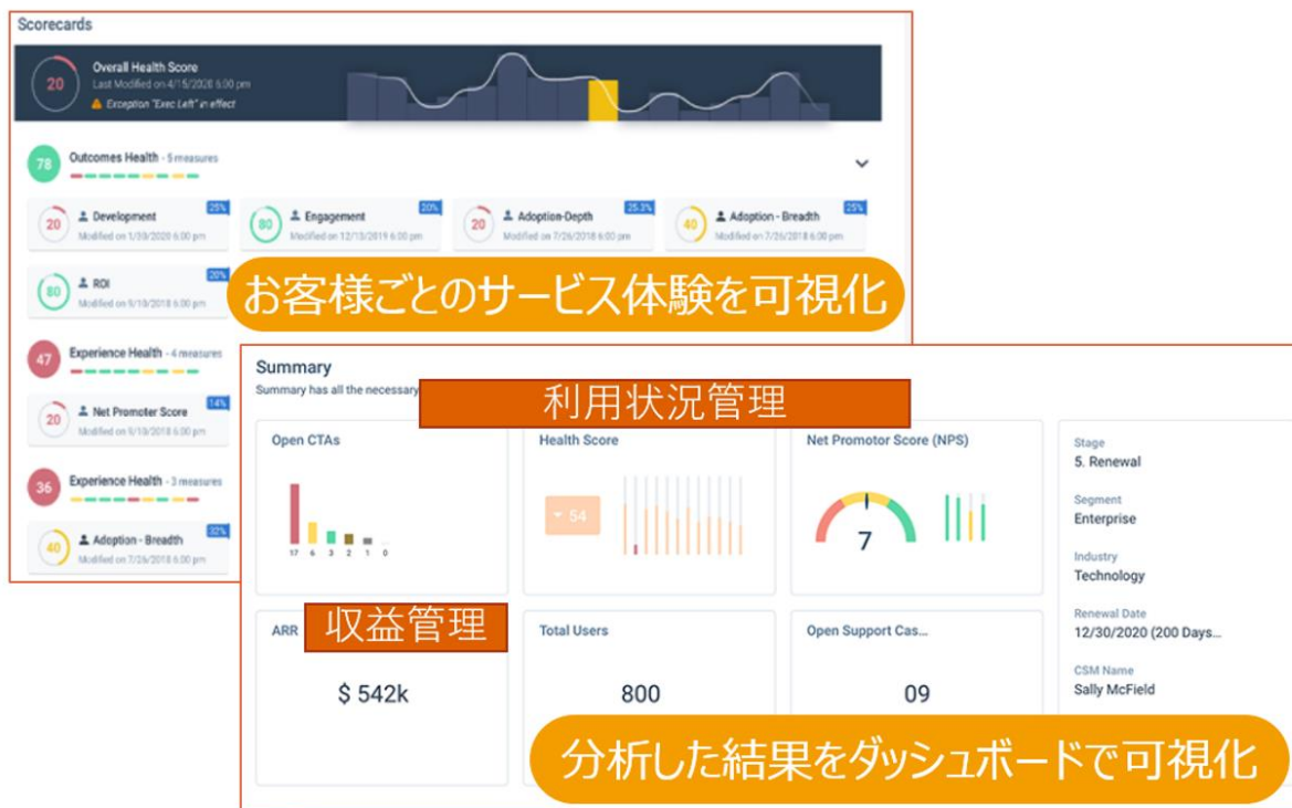
図3 「GainsightCS」の画面イメージ

Gainsight社は、カスタマーサクセスソフトウェアのリーディング企業です。Gainsight社の技術を通じて、リスクある顧客を特定し、懸念を軽減するためのプロセスを構築、顧客接点を効率的に強化し、世界中の企業で顧客の解約防止を支援しています。提供するクラウドサービスによりカスタマーサクセスやサービス体験、収益、顧客情報を結び付けることで、顧客中心の活動を実現します。大手企業がGainsight製品をどのように活用しているかは https://www.gainsight.com/ を参照ください。