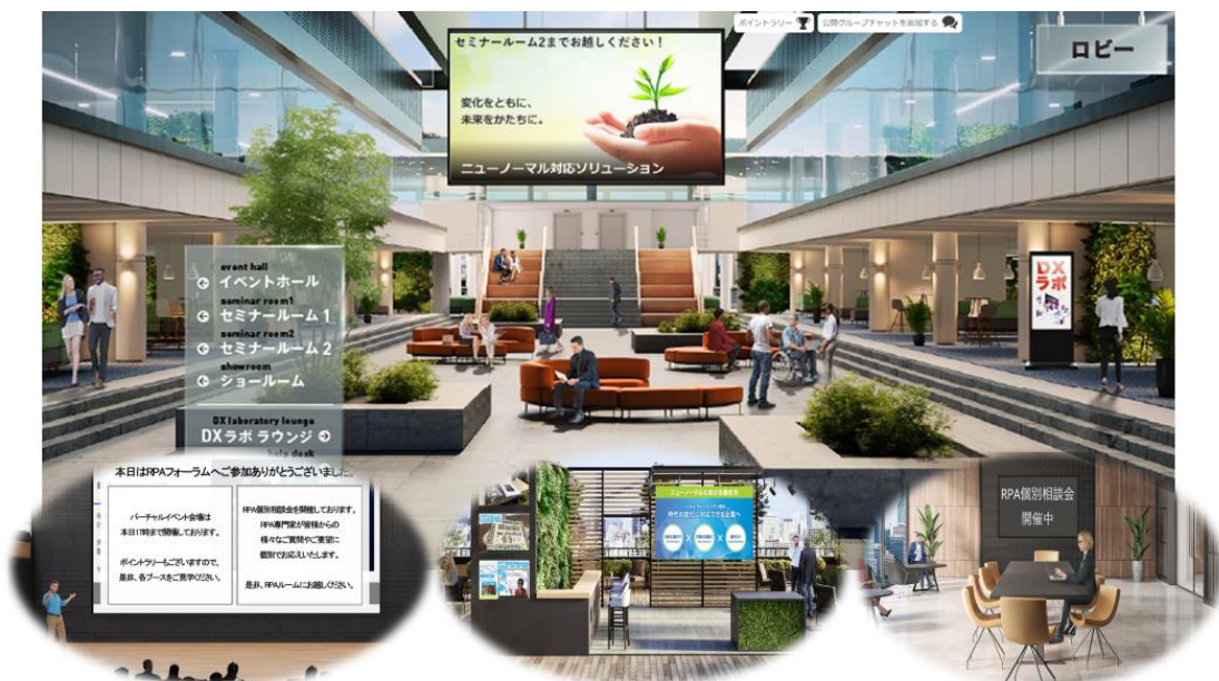
図1: セミナー会場とワークショップを兼ね備えた協創空間のイメージ

日立ソリューションズは今後、自社が開催するセミナーやショールームに加え、顧客やパートナーとオンライン上で協創する場の運営にも、本サービスを活用していきます。