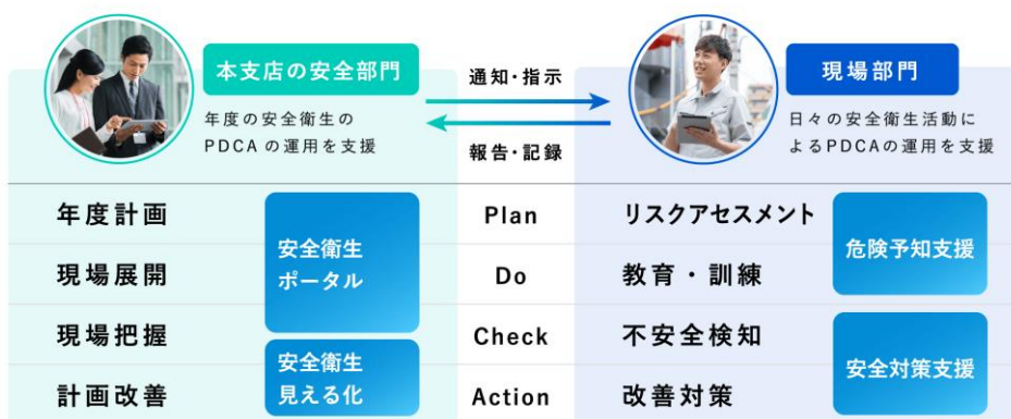
図2:労働安全衛生マネジメント支援ソリューションが支援するPDCA

URL: https://www.hitachi-solutions.co.jp/roudouanzeneisei/sp/