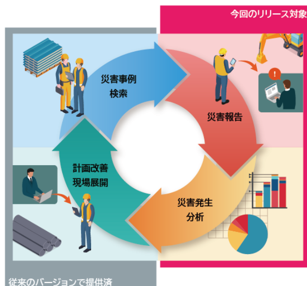
図1:労働安全衛生管理サービスのイメージ図

なおAIによる文書分析はプラントの建設やメンテナンスを行うJFEプラントエンジニアリング株式会社の安全衛生部門と千葉事業所、倉敷事業所、播磨製作所にて、「災害事例検索」は、ライフラインを建設・施工するあすか創建株式会社の関東6拠点にて、POC(概念検証)を行い、安全対策の改善につながる効果を確認しています。