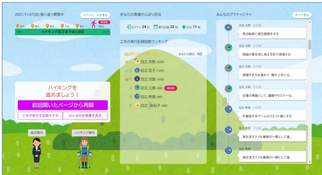
図2： 職場の仲間と共有する画面イメージ