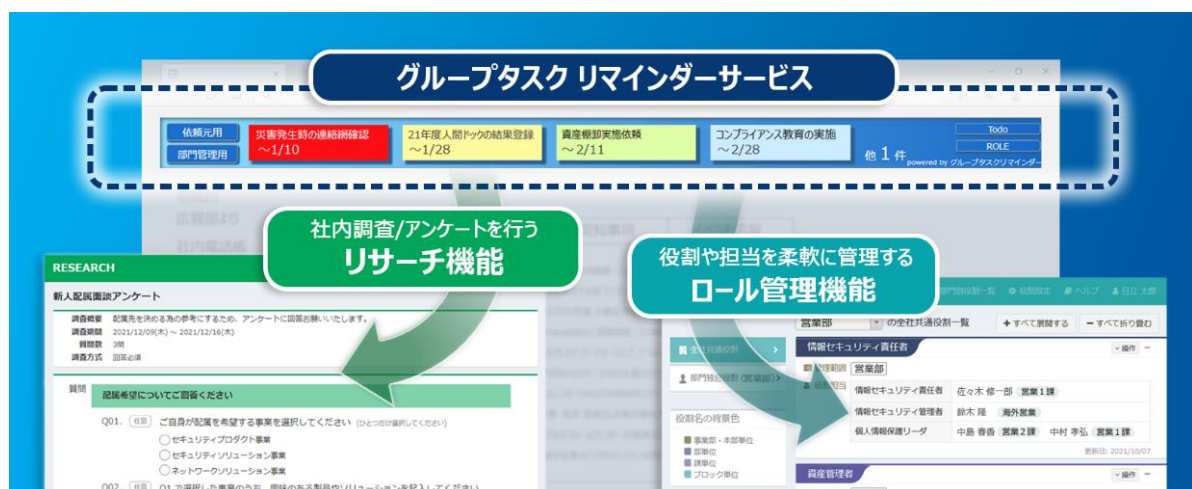
図：グループタスク リマインダーサービスの提供機能イメージ

日立ソリューションズは今後も、GRC業務の効率化を支援し、企業の持続可能な経営に貢献していきます。