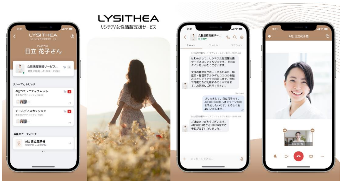
図：「リシテア/女性活躍支援サービス」の画面イメージ（変更になる場合があります）