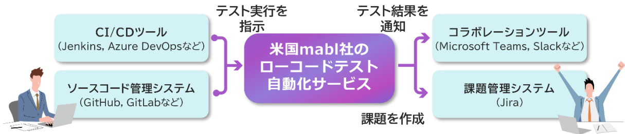
図2 ツール連携による開発パイプラインのイメージ