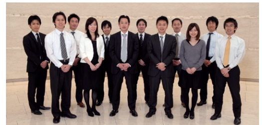
日本生命保険相互会社プロジェクトメンバーの皆様