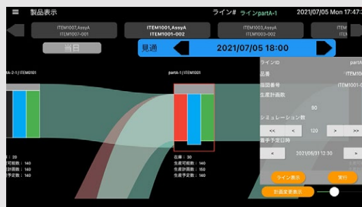
*新機能開発分は2022年1月ごろリリース予定