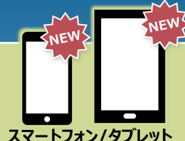
スマートフォン/タブレット