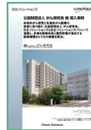
公益財団法人がん研究会様