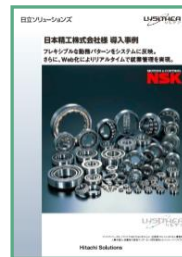
日本精工株式会社様