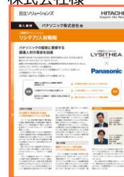
パナソニック株式会社様