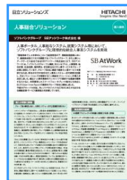
ソフトバンクグループS B ネットワーク株式会社様