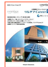
株式会社中電シーティーアイ様