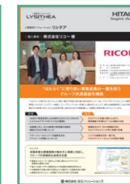
株式会社リコー様