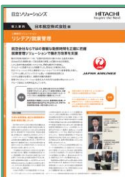
日本航空株式会社様