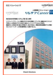
株式会社科学情報システムズ様