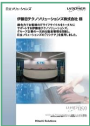
伊藤忠テクノソリューションズ株式会社様

各社の詳細については、リシテア導入事例の紹介ページ ( https://lysithea.jp/case/ ) をご覧ください。