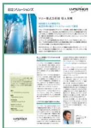
ソニー株式会社様