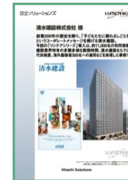
清水建設株式会社様