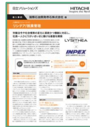
国際石油開発帝石株式会社様