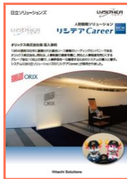
オリックス株式会社様