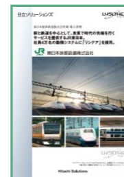
東日本旅客鉄道株式会社様