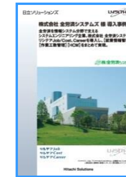
株式会社全労済システムズ様