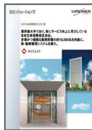
日本生命保険相互会社様