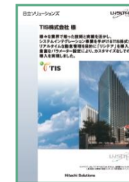
T I S 株式会社様