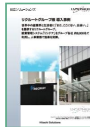
リクルートグループ様